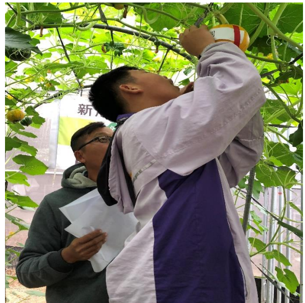
學生參與南瓜刻字 2