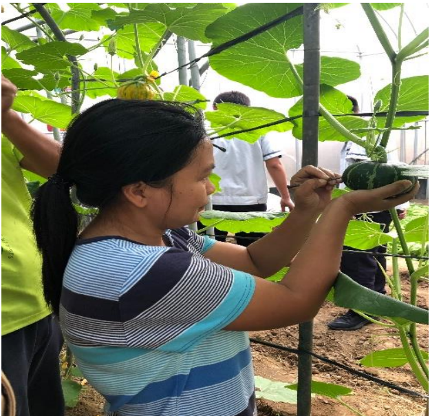
菲律賓四健會草根大使參與南瓜刻字 1