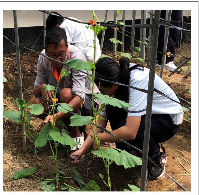
青農指導學生剪枝 2