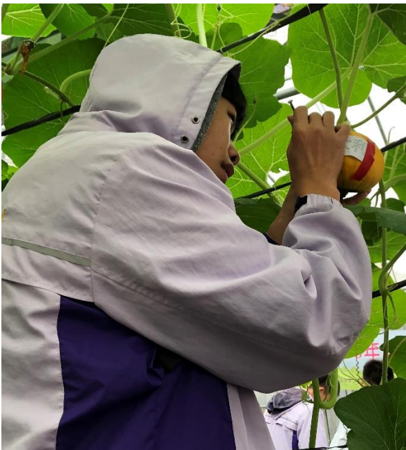
學生參與南瓜刻字 3