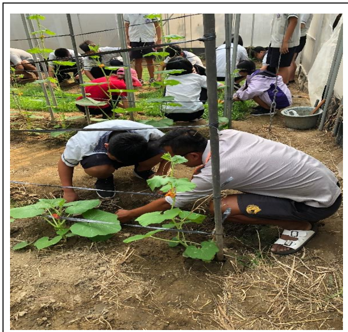
青農指導學生剪枝 1